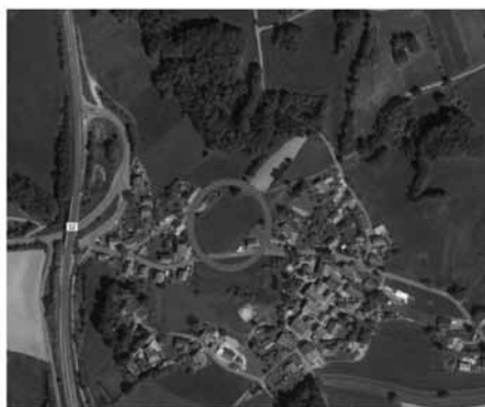
Lageplan mit Geltungsbereich

Das Verfahren zur Aufstellung des Bebauungsplans „Köppenreut“ wird im beschleunigten Verfahren gemäß § 13b i.V. mit § 13a BauGB durchgeführt. Es wird darauf hingewiesen, dass gemäß § 13a Abs. 2 i.V. mit § 13 Abs. 2 und 3 Satz 1 BauGB von der frühzeitigen Unterrichtung und Erörterung nach § 3 Abs. 1 und § 4 Abs. 1 BauGB, von der Umweltprüfung nach § 2 Abs. 4 BauGB, von dem Umweltbericht nach § 2a BauGB, von der Angabe nach § 3 Abs. 2 Nr. 2 BauGB, welche Arten umweltbezogener Informationen verfügbar sind, von der zusammenfassenden Erklärung nach § 10 a Absatz 1 und vom Monitoring nach § 4c abgesehen wird. Der Flächennutzungsplan wird nachträglich im Wege der Berichtigung angepasst.