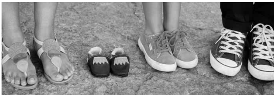
Über finanzielle Leistungen und Hilfen rund um die Schwangerschaft informiert die staatlich anerkannte Beratungsstelle für Schwangerschaftsfragen am Landratsamt (Abteilung Gesundheitswesen).

Staatlich anerkannte Beratungsstelle für Schwangerschaftsfragen am Landratsamt Freyung-Grafenau berät in persönlichen Gesprächen