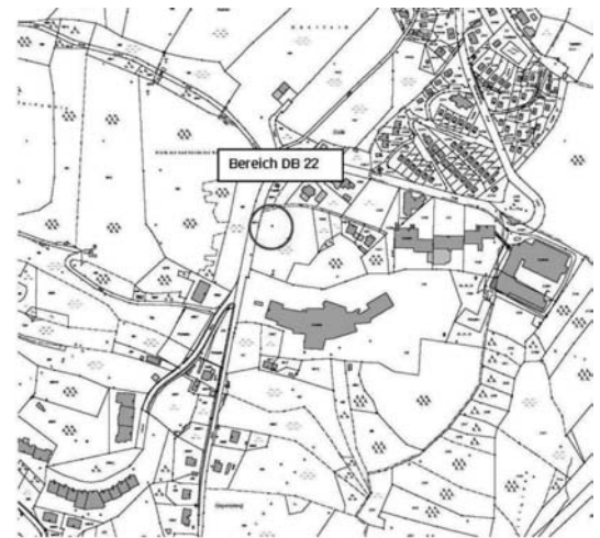
Auszug digitale Flurkarte M = 1:5000

Die Teilfläche des Grundstücks FlNr. 479 der Gemarkung Ort bildet den Geltungsbereich der 22. Änderung des Bebauungsplanes „Solla-Hermannsau-Geyersberg“. Die für die Bebauung auszuweisende Fläche befindet sich am nördlichen Rand des Ortsteils Geyersberg, nördlich der Kurklinik. Die Teilfläche hat eine Größe von ca. 1720 m 2 und erstreckt sich in Nord-Süd-Richtung mit einer Länge von ca. 45 m in Ost-West-Richtung mit einer Länge von ca. 38 m. Das auszuweisende Baufenster soll mit einem Einfamilienhaus mit Einliegerwohnung bebaut werden.